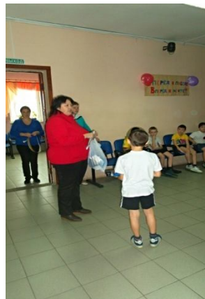
На мероприятие присутствовал социальный педагог и наградил их призами!